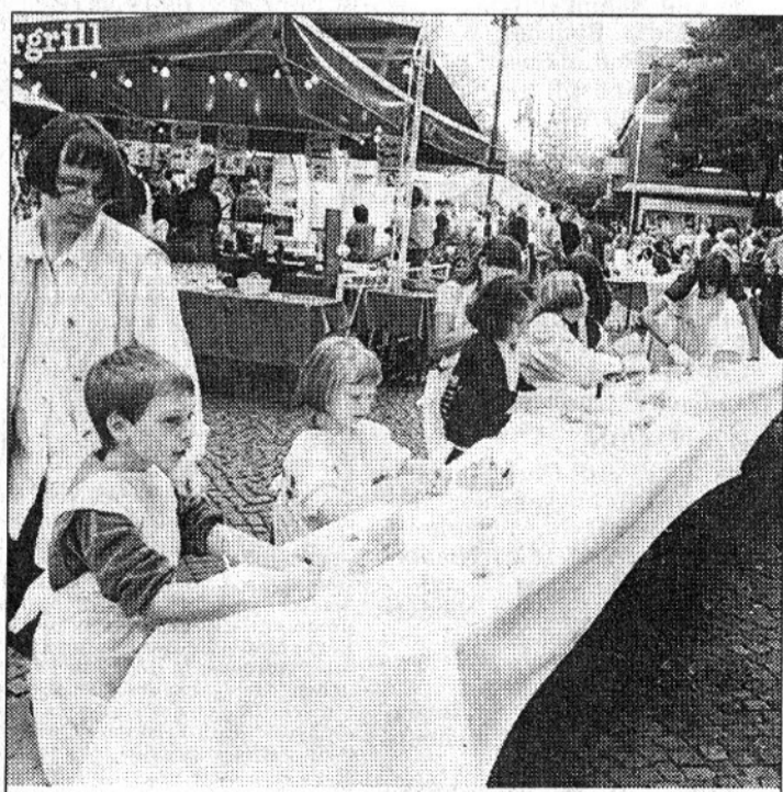
Rund 200 Meter lang war die „Töpferei“, die sich am Samstag durch die Stadtlohner Innenstadt zog.

Die fertig gebrannten Teile können als Erinnerung in den nächsten Wochen abgeholt werden. Sollte alles nicht reichen für das Rekordbuch, so reicht es zumindest für die Erinnerung, mit dabei gewesen zu sein, als der Markt in Stadtlohn von geballter Kinderkreativität in Töpferfarn nur so überquoll.