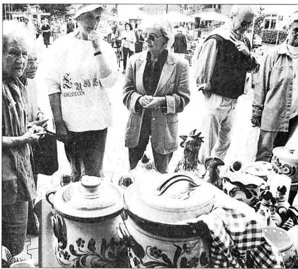
Ob Hahn oder Sauerkrauttopf – beim Stadtlohner Herbst war das Angebot, getöpft und aus Ton, übergroß.

Stadtlohner Töpfermarkt erlebte gelungene Premiere