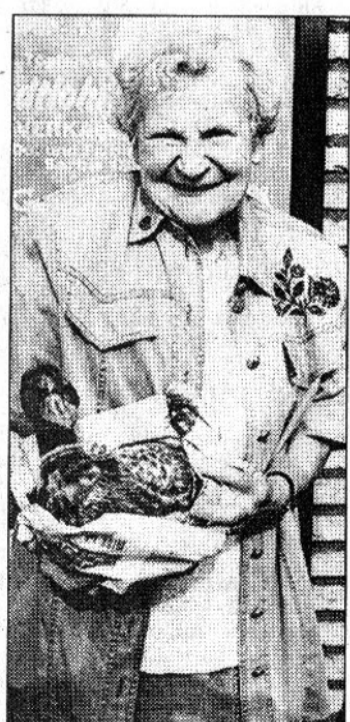
Auch ein Schnäppchen gemacht, auf dem Töpfermarkt.